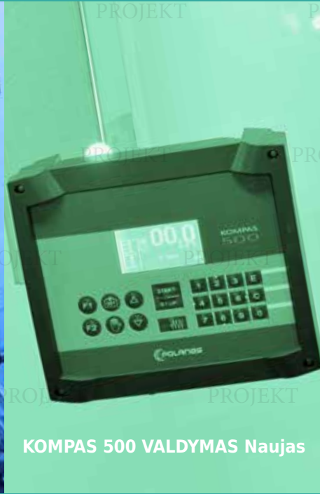
KOMPAS 500 VALDYMAS Naujas