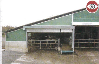
Le tapis d'alimentation ne prend que 1,75 m sur les 5 m qu'occupait auparavant l'allée de distribution. Une nouvelle rangée de logettes et un couloir ont pu être créés en prolongeant la toiture.