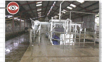
La nouvelle salle de traite par l'arrière de deux fois dix places a été installée dans une rangée de logettes double.