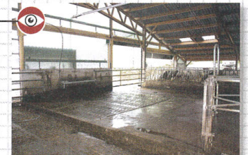
Sous la nouvelle travée, le Gaec a installé une aire d'attente sur callebots.