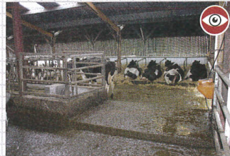
À l'autre extrémité du tapis, les vaches peuvent circuler pour passer d'un côté à l'autre.