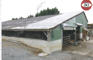
À l'extrémité nord, le bâtiment a été allongé avec une travée de 6 m supplémentaires.